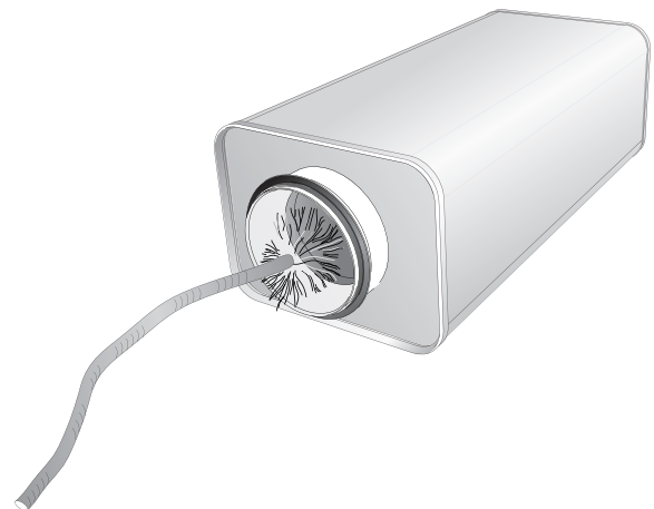
Figur 2. Rengjør med en plastbørste

For kontroll av trykkfallet over lydempereen, se lydempereens produktark, eller produktvalgsprogrammet ProSilencer på www.swegon.no